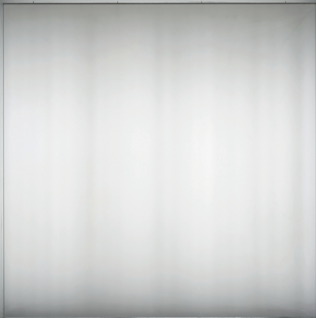
Mary Corse, Untitled (Space + Electric Light) , 1968. Lumière à l'argon, verre plastique et générateur à haute fréquence, 115 x 115 x 12 cm. Musée d'art contemporain de San Diego.